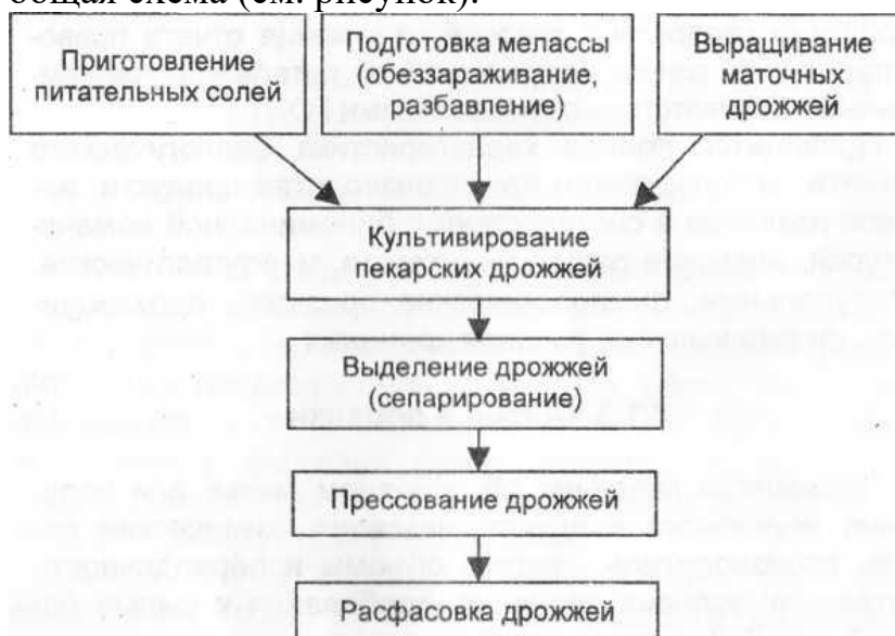
Рисунок – Технология получения прессованных пекарских дрожжей (пример)

Описывается технология получения конкретного продукта. При этом вначале дается общая схема (см. рисунок).