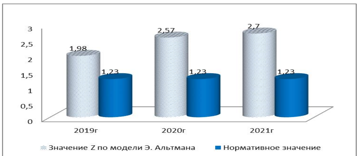
Рисунок 2 - Динамика значения Z, вероятности банкротства по модели Э.Альтмана