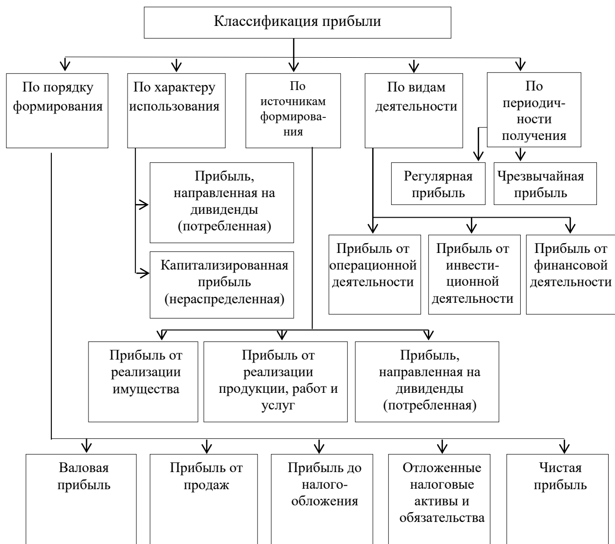
Рисунок 3 – Классификация прибыли

Оформление ссылок. Библиографическая ссылка предусматривает расположение информации об источнике в списке литературы. При упоминании автора работы или работ в квадратных скобках указывается номер источника в пределах списка литературы, например [6]. При ссылке на несколько работ одного автора или работы нескольких авторов приводят номера этих работ, например: [1,7,22]. При ссылке на определенные страницы указывают порядковый номер источника и страницу, на которой расположен данный текст, например: [11, с.72]. Если ссылка на многотомное издание, кроме того, указывают номер тома, например: [12, т.1, с.455].