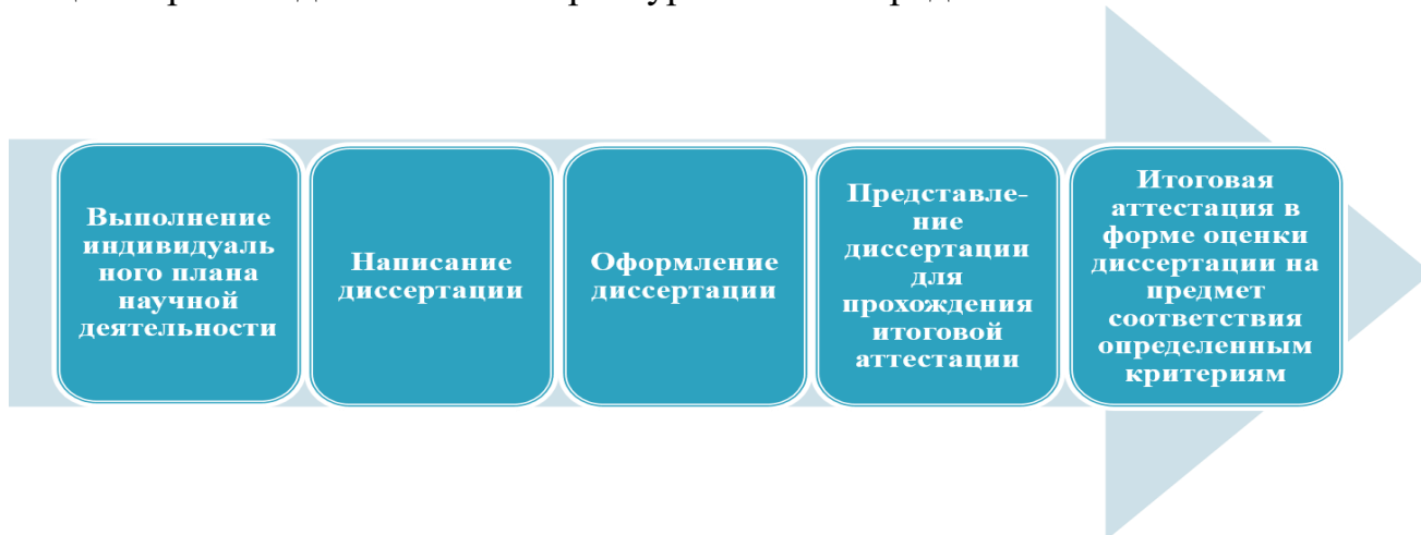
Рисунок 1 – Общие этапы подготовки диссертационной работы к итоговой аттестации 3

Работа над диссертацией – это длительный и трудоемкий процесс, поэтому если молодой исследователь планирует связать свое будущее с наукой, то обучение в аспирантуре является неотъемлемым элементом данной деятельности. В общих чертах подготовка в аспирантуре включает ряд обязательных этапов: